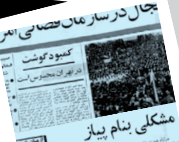
اصلاً «مشکلی به نام پیاز» رو بی خیال؛ کمیاب شدن گوشت در تهران و رسیدن پیاز نورو چی می‌گی؟