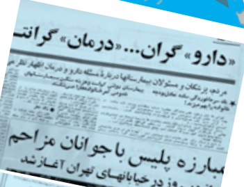
می‌گن دارو و درمان، رایگان بود و مردم مشکل دارو و دکتر نداشتن. این رو باور کنیم یا این خبر که درمان یک سرما خوردگی ساده، تعادل بود چه خانواده رو به هم می‌ریخت؟