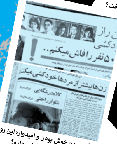
می‌گن مردم خوش بودن و امیدوار؛ این رو باور کنیم یا آمار خودکشی‌ها رو؟