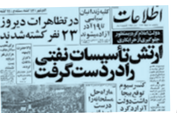
می‌گن شاه می‌گفت: می‌رم تا خون از دماغ هموطنانم ریخته نشه. این رو باور کنیم یا خبر کشته شدن ۲۳ نفر، فقط در یک روز، اون هم در کردستان رو؟