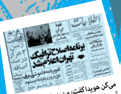
می‌گن هویدا گفت: من به خودکار ۵ ریال تحویل گرفتم؛ ۱۳ سال بعد، همون ۵ ریال بود! این رو باور کنیم یا افزایش ۲ هزار درصدی زمین رو؟