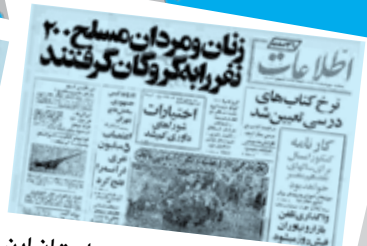
راستی اگه امنیت بود، پس داستان این گروگان‌گیری ۲۰۰ نفره چی بوده

وطن فرورشان، سلطنت طلبان و همه زخم خوردگان از انقلاب و نظام اسلامی، از هر روش و ترفندی برای سیاه‌نمایی و به چالش کشیدن دستاوردهای انقلاب، استفاده می‌کنند. آنها با بهره‌گیری از قدرت و امپراتوری رسانه‌ای خود، تلاش می‌کنند با روایت‌های غلط و ساختگی، تصویری مثبت از وضعیت مردم در دوره پهلوی را جا بیندازند تا چنین القا کنند که دوران پهلوی، دوران درخشانی بود است. این روایت‌ها را از زاویه روزنامه‌های چاپ شده در همان زمان، مورد بررسی قرار داده‌ایم.