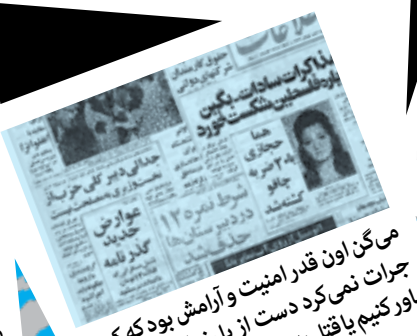
می‌گن اون قدر امنیت و آرامش بود که کسی جرات نمی‌کرد دست از پا خطا کنه؛ این رو باور کنیم یا قتل به خانم با ۲۰ ضربه چاقو رو؟