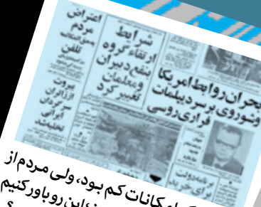
می‌گن اگر امکانات کم بود، ولی مردم از همونی که بود، راضی بودن؛ این رو باور کنیم یا اعتراض مردم به پول مکالمه تلفن رو؟