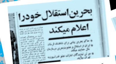
می‌گن شاه این قدر مقتدر بود که وقت‌های ملاقات برای کشورهای عربی، زیر ۴ ماه نبود؛ راستی این رو باور کنیم یا... یا بحرین استان چندم ایران بود که از ایران گرفتنش؟